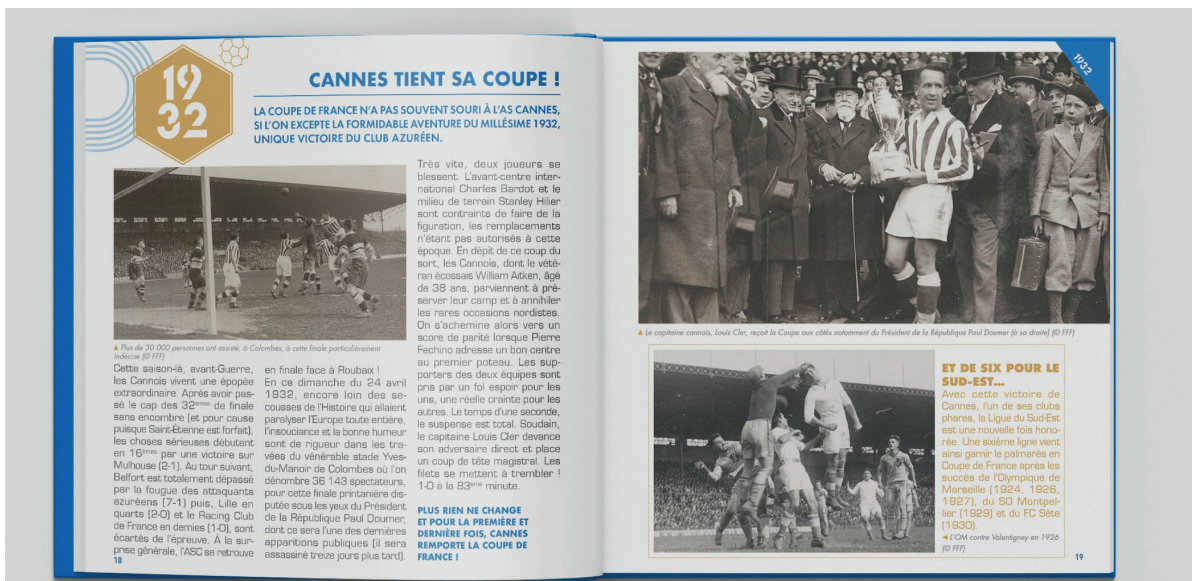
Julidäumsbuch zum 100-jährigen Bestehen der Mittelmeer-Fußballliga.