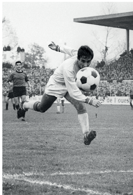
Spiel des Fußballclubs Nantes gegen den Stade Rennais im Stadion Route de Lorient am 11. November 1965.