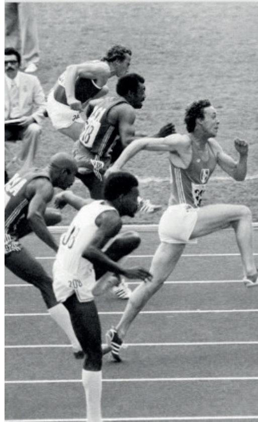
Guy Drut, 110 Meter Hürden, Olympische Spiele in Montreal, 1976

Mit dem Eintritt der Welt in die digitale Welt beauftragte das Institut national du sport, de l'expertise et de la performance, Arkhênum mit der Digitalisierung von Sportzeitungen, darunter auch L'Equipe, um Archivfotos in digitalem Format anzubieten und damit den Zugang sowohl für Mitarbeiter als auch für Verbraucher zu erleichtern. Diese strategische Entscheidung ermöglicht es der Zeitung nicht nur, neue redaktionelle Inhalte zu schaffen, sondern auch eine neue Verbindung zwischen der Geschichte des Sports und seinen aktuellen Ereignissen herzustellen.