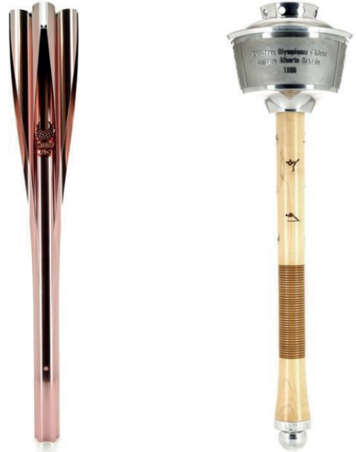
Fackeln der Olympischen Spiele

2020-2021, verschiedene französische Einrichtungen des Kulturerbes - Arkhênum Im Rahmen einer Ausschreibung für Projekte zur konzertierten Digitalisierung und Valorisierung im Bereich Sport hat Arkhênum